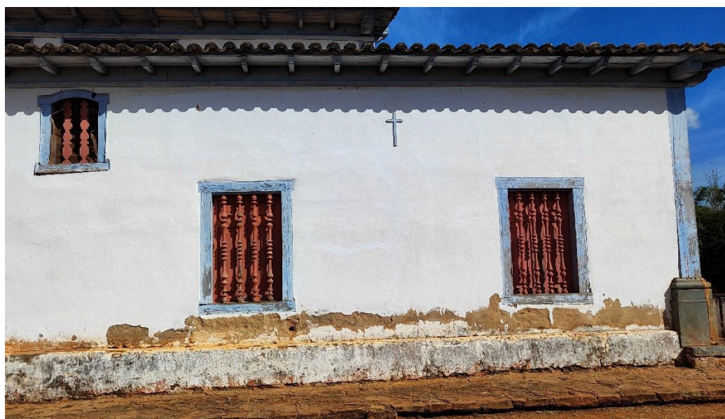
Detalhe do reboco no embasamento em uma das fachadas laterais Data: 09/05/2024

Também é possível verificar através das partes de desprendimento do reboco no embasamento da edificação que os elementos estruturais em madeira apresentam indícios de danos causados por cupins e umidade ascendente.