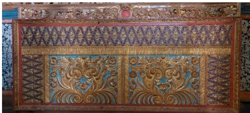
Detalhe do altar Data: 09/05/2024