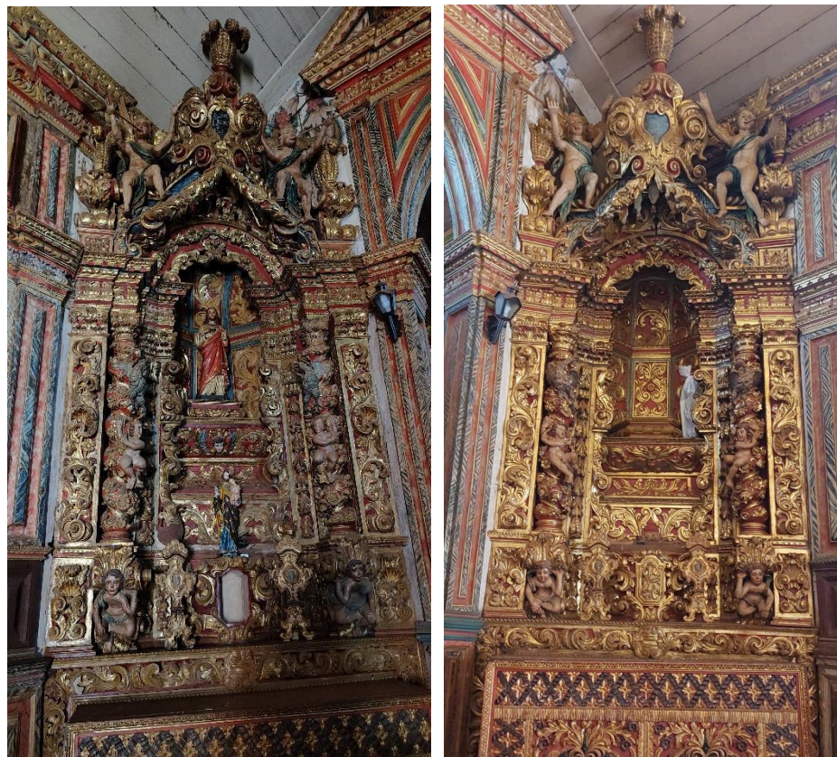
Altars colaterais Data: 09/05/2024