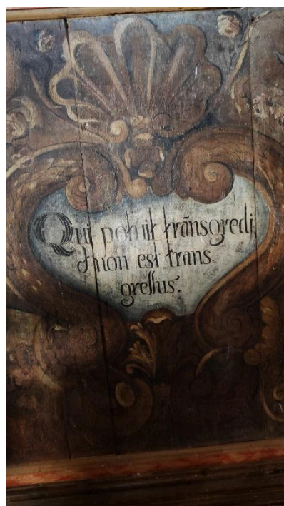
Detalhes do altar Autoria: Francielle Ferreira Data: 09/05/2024