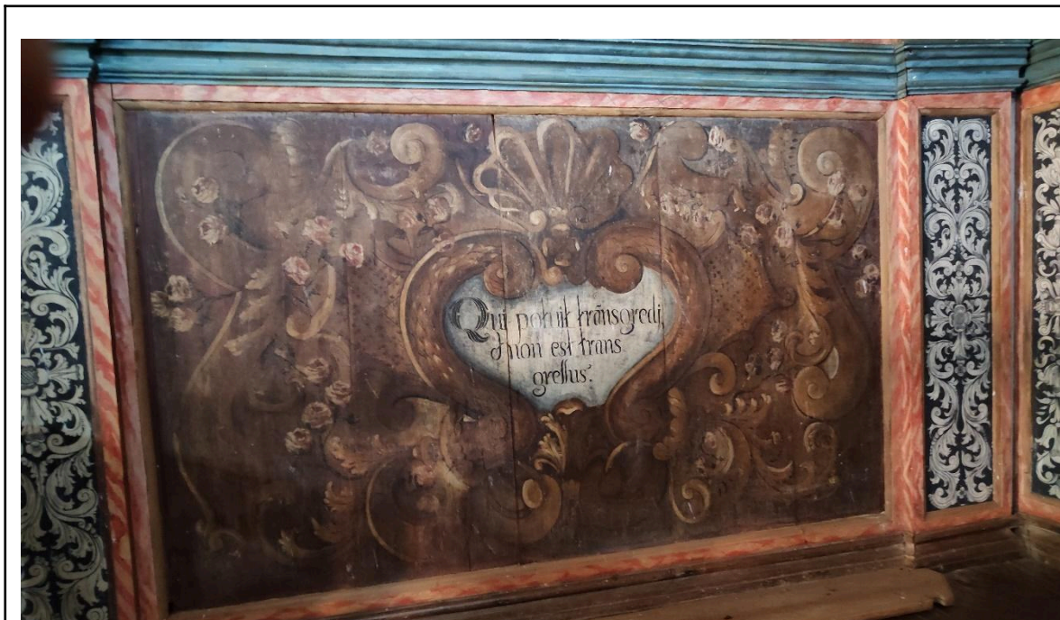
Detalhe do altar Autoria: Francielle Ferreira Data: 09/05/2024